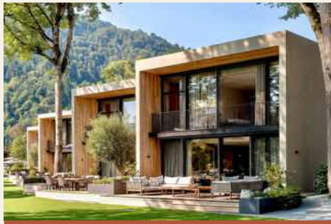
SISTEMA ALBERGO MODULARE