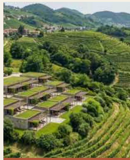
AGRITURISMO &amp; COLLINA

Glamping fronte mare, beach resort, lodge lacustri. Pietra e legno, schermature solari, ampie aperture sul paesaggio.