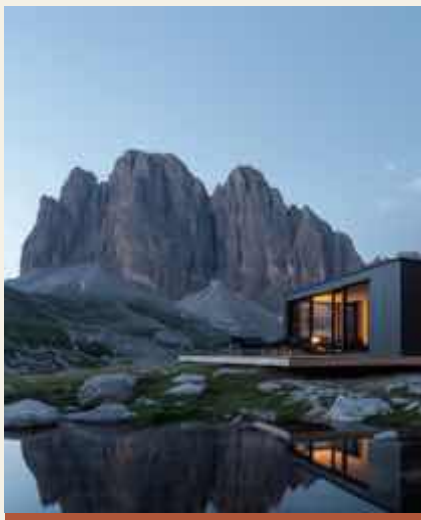
ALPINO &amp; MONTANO

X-BOX HOTEL dialoga con il luogo. Finiture, cromie e dotazioni si adattano al contesto montagna, mare, campagna mantenendo invariate prestazioni, tempi e logica costruttiva.