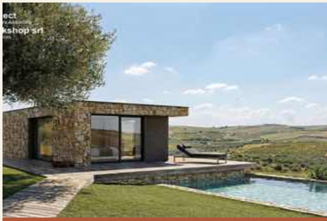
BUILD OFFSITE – MODULO SINGOLO