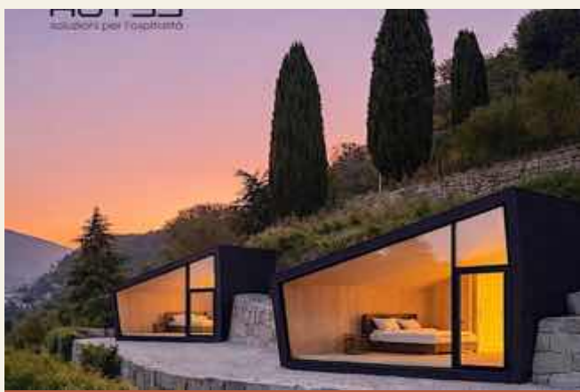
CAMERE FRA LE VIGNE DEL RPOSECCO