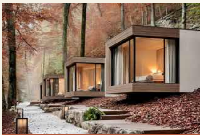
LODGE TRA GLI ALBERI