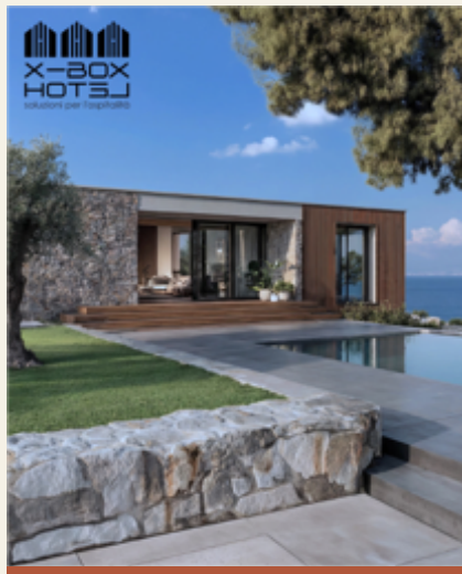
COSTA &amp; ACQUA

Resort di quota, rifugi modulari, ampliamenti per hotel di montagna. Coperture a falda, legno scuro, posa su geopali per non alterare il terreno.